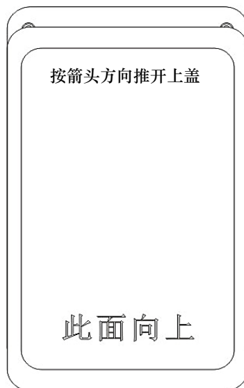
图4.1 顶盖打开方法说明