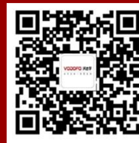
365汽车在线APP 小沃APP / 沃装APP