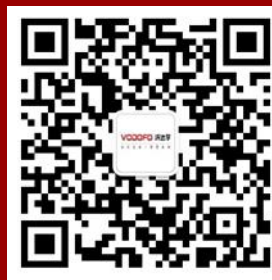
沃达孚企业 公众号