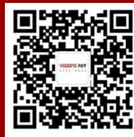
365汽车在线APP 小沃APP / 沃装APP